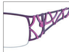
No.02 バイオレッド／ローズ