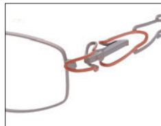
No.01 シャンパン／オレンジ