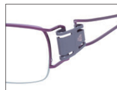
No.03 バイオレッド／グレー