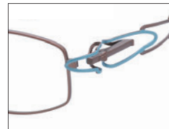
No.03 ブラウン／ターコイズ