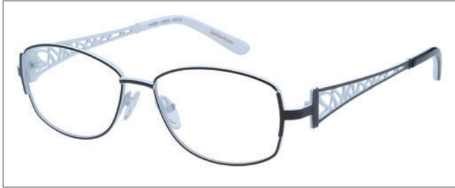
No.01 ブラック／ホワイト