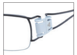
No.04 ブラック／ホワイト