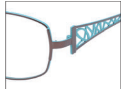
No.04 ブラウン／ターコイズ