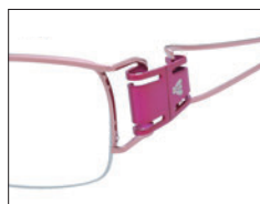
No.02 シャイニーピンク