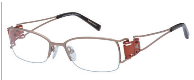
No.01 シャンパン／オレンジ