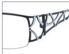
No.01 ブラック／ホワイト