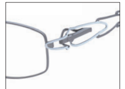
No.04 シルバー／ホワイト